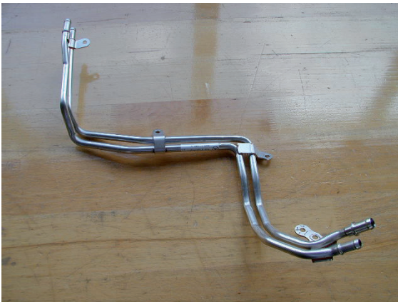
Bild 3 - Fertiges Kraftstoffleitungsbündel