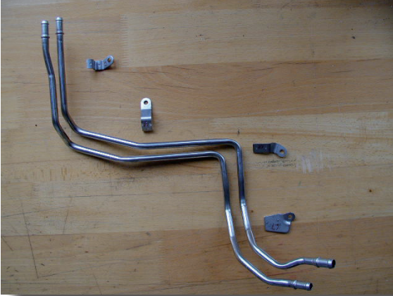
Bild 1 - Einzelteile , komplex gebogene Leitungen