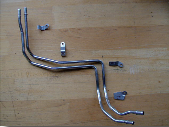
零件，经过复杂弯曲的管道