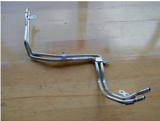
准备好的燃料管束